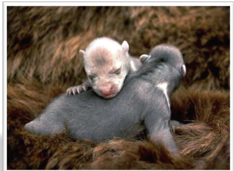
Orsons qu'acaban de vèder