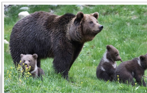
Orsada dab sa mair