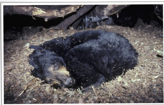
Ors a ivernar

Quan sortirà, s'en anirà cercar un aute ors (mascle o femèla) atau de hèser orsetons.