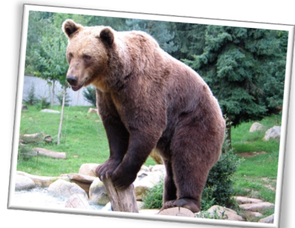
L'ors daus Pirenèus